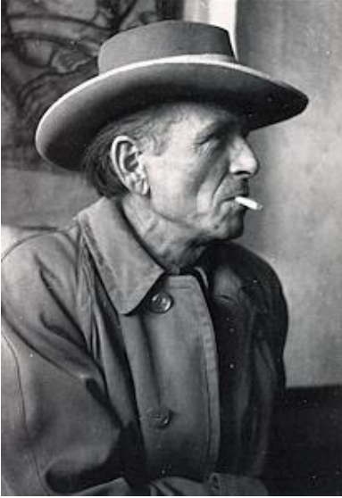
Otto Dix en 1947