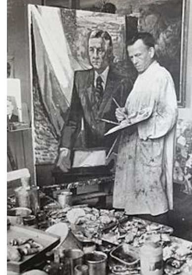
Otto Dix, années 1940, dans son atelier à Hemmenhofen